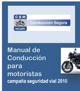
Manual de conducción

Dependiendo de la duración del curso se incluirá, solo el desayuno o también la comida . A la finalización de cada uno de ellos se realizará la entrega del diploma acreditativo , manual de conducción y 'bolsa obsequio' correspondiente para cada alumno. La jornada concluirá con el sorteo de regalos cedidos por los patrocinadores y la fotografía oficial de recuerdo.